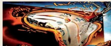
SALVADOR DALI - Persistance de la mémoire