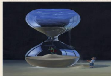
LES FRERES BONNEC- la fuite du temps.